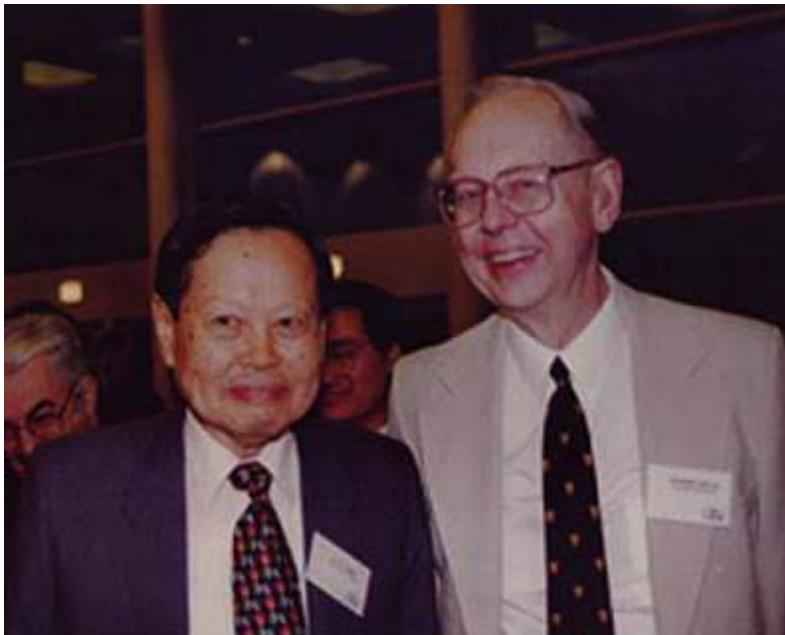
Figure 1: Robert Mills (derecha) y Chen Nin Yang